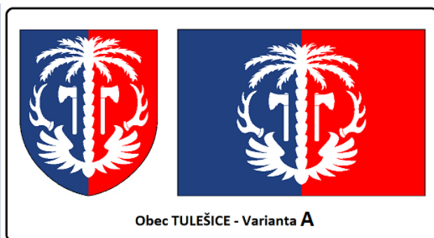
Obec TULEŠICE - Varianta A