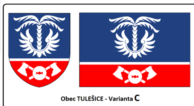
Obec TULEŠICE - Varianta C

Modro-červená kombinace základních barev symbolizuje vodu a oheň a odkazuje tak k patronu obce – sv. Floriánovi.